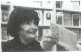
» 100 éve született Szabó Magda

Tudni bölcsen, a hazát" ( A régi panasza , 1877), talán azt hiheted, elég egy utcai tüntetésen részt venni, egy-két harcias kommentet írni, név nélkül, s eltűnni a virtuális világban. Na, nem. Arany utolsó éveinek élményei és te a jelenkori tapasztalataid bizony sokszor egybevágóak. Hogy te nem vagy hajlandó kitérni az úri löcsiszárok elől? Hogy élvezned a rangot, amit kaptál? Hát persze, de előbb-utóbb mindenkinek szembe kell néznie hajdani önmagával, álmaival, mint Arany tette az Epilógusban ; s mi lesz, ha kiderül, tévedtél?