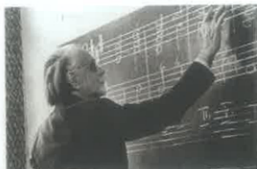
» 50 éve halt meg Kodály Zoltán