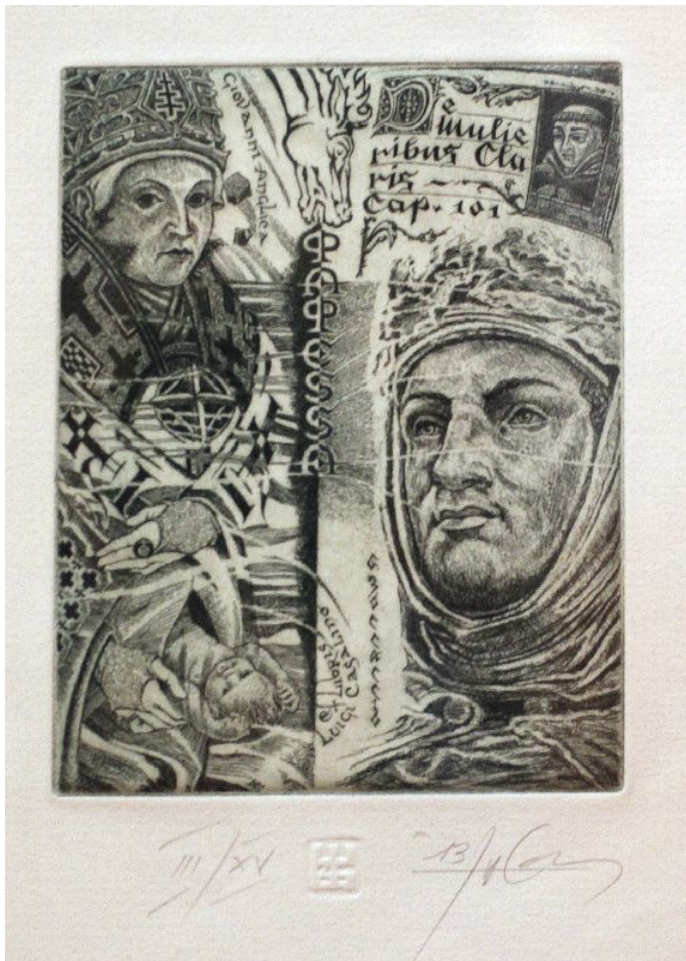
[3]A könyv már az ókortól értékes tárgynak számított, birtoklása tekintéllyel járt, ezért gondosan