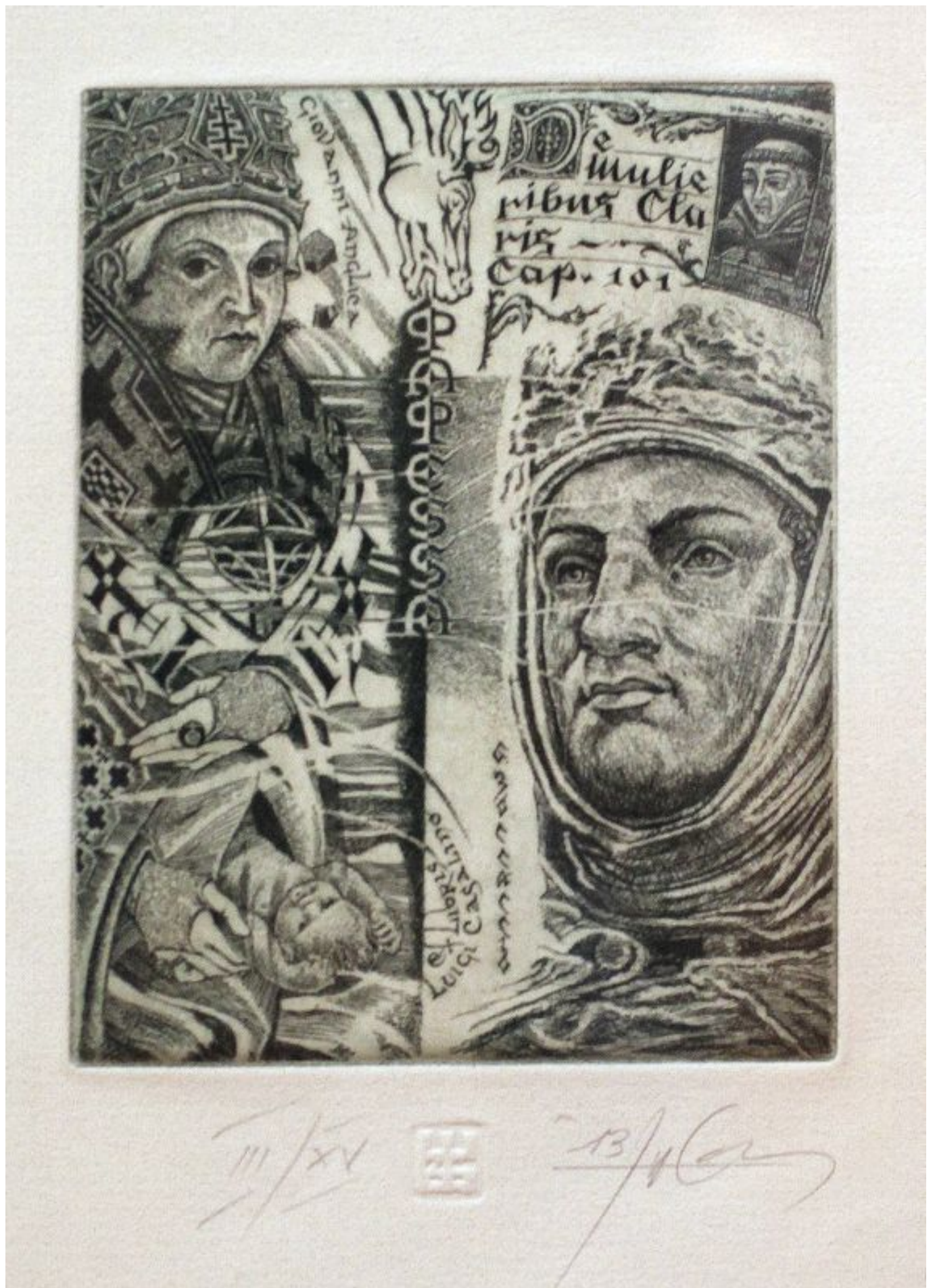
[3]A könyv már az ókortól értékes tárgynak számított, birtoklása tekintéllyel járt, ezért gondosan