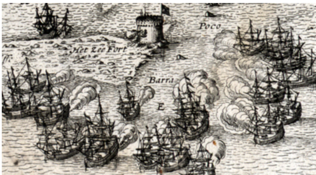
Olinda 1630. évi

Az 1590-es évektől a Földközi-tengeren megélénkülő holland kereskedelmi hajózás részletes és holland nyelvű navigációs könyveket és térképeket igényeltek. Ezen igények kielégítésére készült a tragikus sorsú, az Északkeleti-átjáró keresése közben 1597-ben meghalt kiváló holland tengerész és térképkészítő Willem Barentsz. (1550-1597) alapvető műve, a Nieuwe beschryvinghe ebnde Caertboeck vende Midlandtsche Zee . A műben számos részterület hajózási térképe mellett az egész Mediterraneumot bemutató hajózási térképet is közreadtak, amely a szakirodalom szerint a kor neves hajózási és térképszeti szakértőjének, Pieter Planciusnak (1552-1622) az alkotása. A térképet azonban nemcsak a navigációs mű részeként, de holland tengerészek, kormányosok önállóan is használták. Talán az itt látható példány is, amelynek bal oldali hiányzó negyede másolattal lett kiegészítve, ilyen használatban sérülhetett meg egykoron.