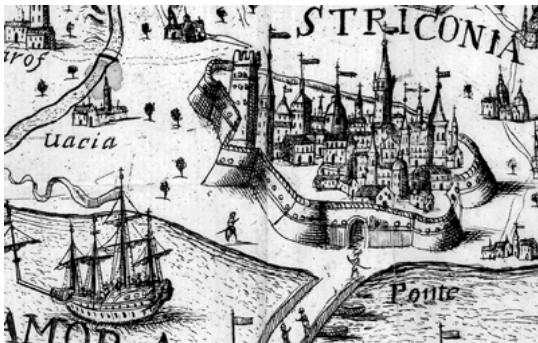
Bécs és Belgrád