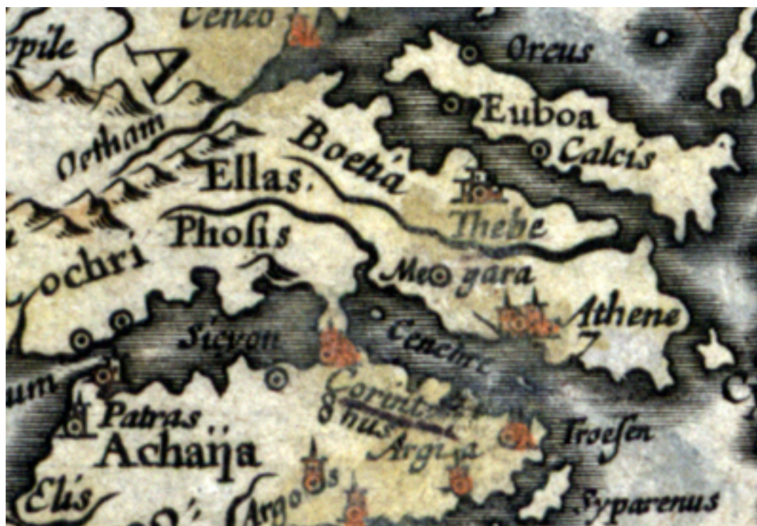
Az apostolok útjai és