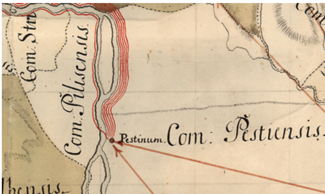
kereskedelme 1773-ban [6]

Korabinszky János Mátyás (1740-1811) tanár, könyvkereskedő és térképszerkesztő nem kisebb feladatra vállalkozott e térképe elkészítése során, mint bemutatni Magyarország természeti-gazdasági erőforrásait. A világ ez az első olyan térkép, amely egy ország természeti és gazdasági erőforrásait mutatta be nagy részletességgel, ma ilyen feladatot a nemzeti atlaszok töltenek be, amelyek mögött tudományos intézet sora áll. Korabinszky elsősorban levelezései alapján gyűjtötte össze tematikus térképe megszerkesztéséhez szükséges adatokat.