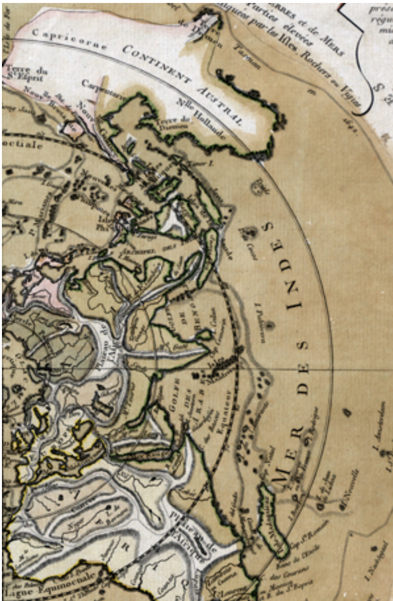
A szárazföldek és tengerek