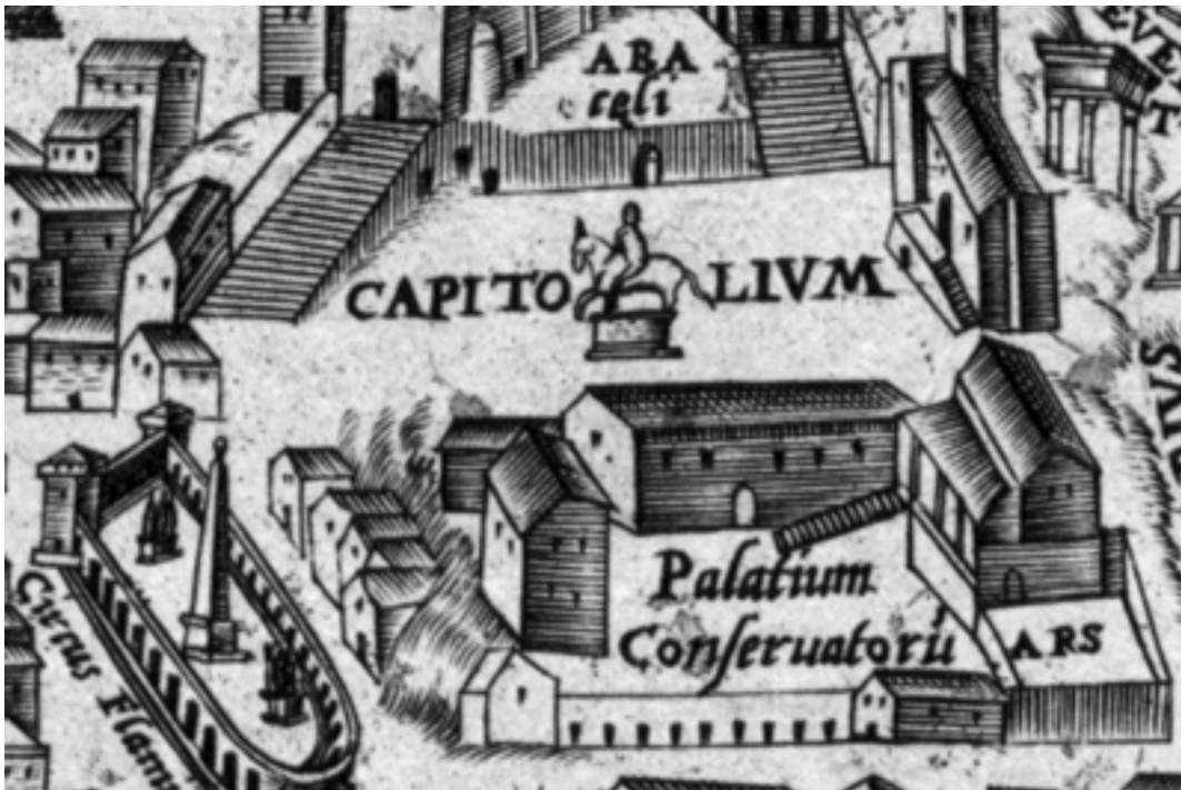
Az ókori Róma [10]

A világ első földrengéstérképe, amelyről már leolvasható volt az egyes területen a károkozás mértéke. Komáromtól a Balaton északi részéig húzódó terület szeizmikusan Magyarország egyik legaktívabb területe. 1810. január 14-én reggel 6 óra után nem sokkal pattant ki a Mór környezetében z egyik legjelentősebb károkat okozó magyarországi földrengés. A földrengésről az egyik szemtanú, a Móron tartózkodó bodajki jegyző az alábbiakat vetette papírra: "Elsőbben is maga körül és alatta mindent egyik oldalról a másikra hullámos mozgásban rémülten látott inogni, majd ezen mozgás ismét függőleges mozgássá változott, minek folytán minden, amit látott, föl alá mozgott. Mindez még semmi kárt nem okozott, de azután a rögtön erősödő földmozgásra az épületek előtte összeroskadtak." E térkép Kitaibel Pál (1757-1817) Tomtsányi Ádámmal (17?-18?) közösen írt Dissertacio terre motu in genere in specie Morensis műben látta meg a napvilágot.