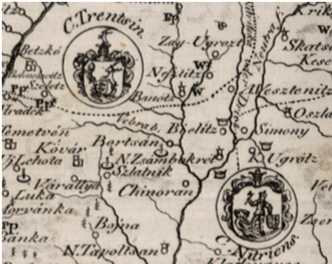
természeti és gazdasági erőforrásait bemutató térképe 1791-ből [5]

Novissimaregni Hungariae potamographica et telluris productorum tabula. – Wasser und Producten Karte des Koenigreichs Ungarn Magyarország természeti tulajdonságának tüköre (Vienna)