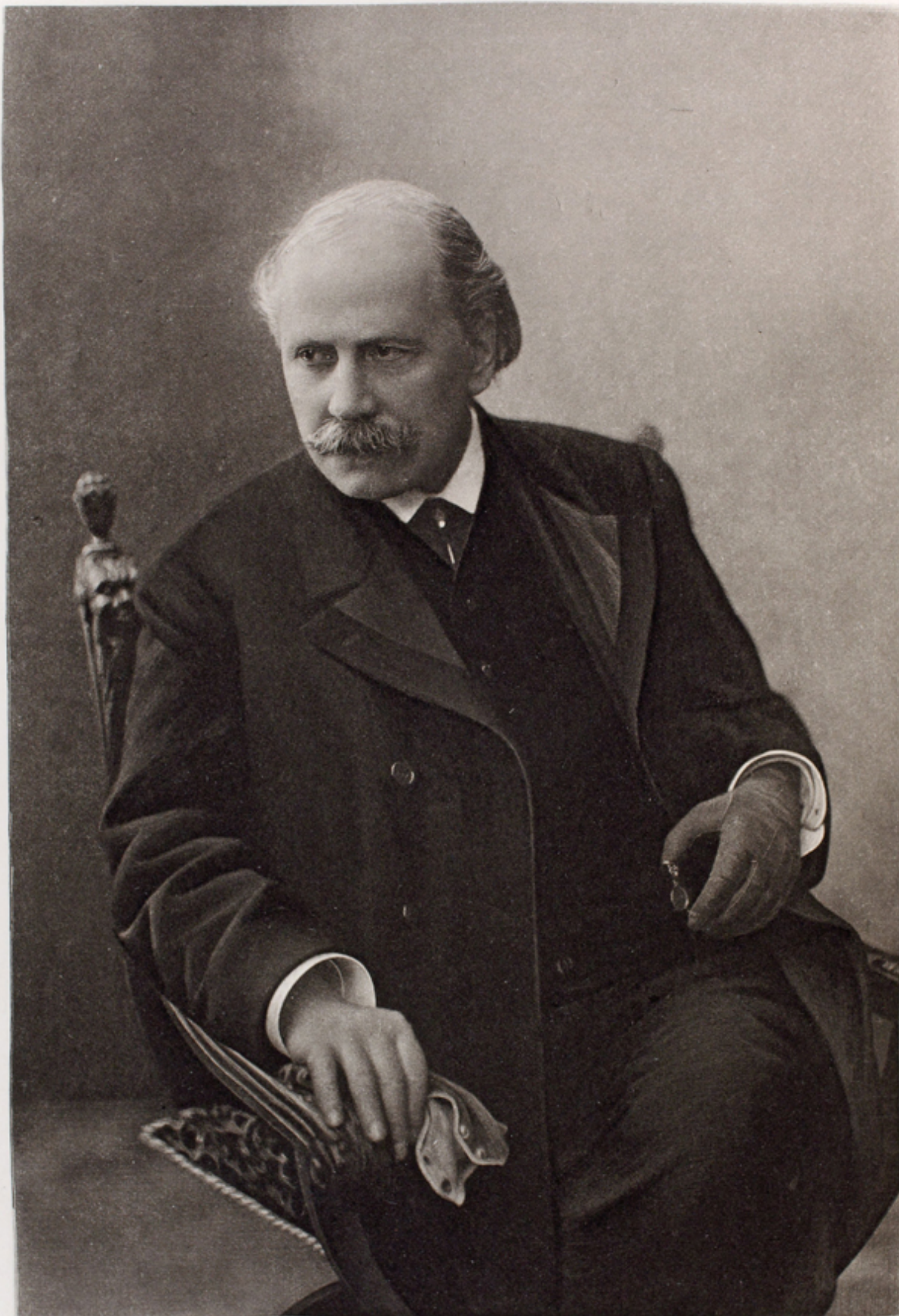
Imp. Ch. Wittmann