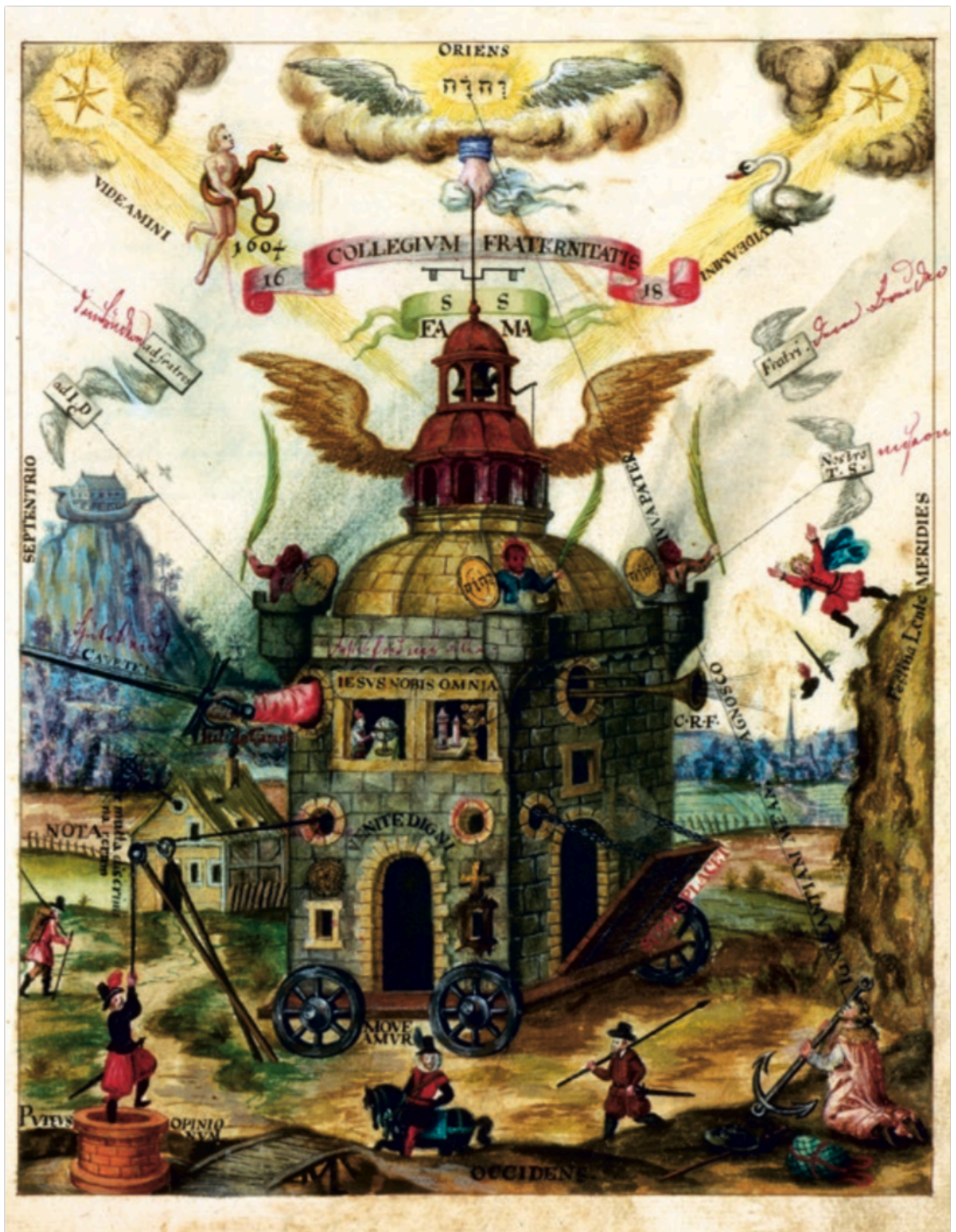
[1] A Ritman Library művelődéstörténeti kiállítása az Országos Széchényi Könyvtárban

Februártól egyedülálló vándorkiállításnak ad otthont a nemzet könyvtára. A hermetikus filozófia irodalmának gyöngyszemei, 400 éves, klasszikus rózsakeresztes iratok kerülnek bemutatásra, melyek egykor a művelt európai világot „általános, világméretű reformációra” szólították fel.