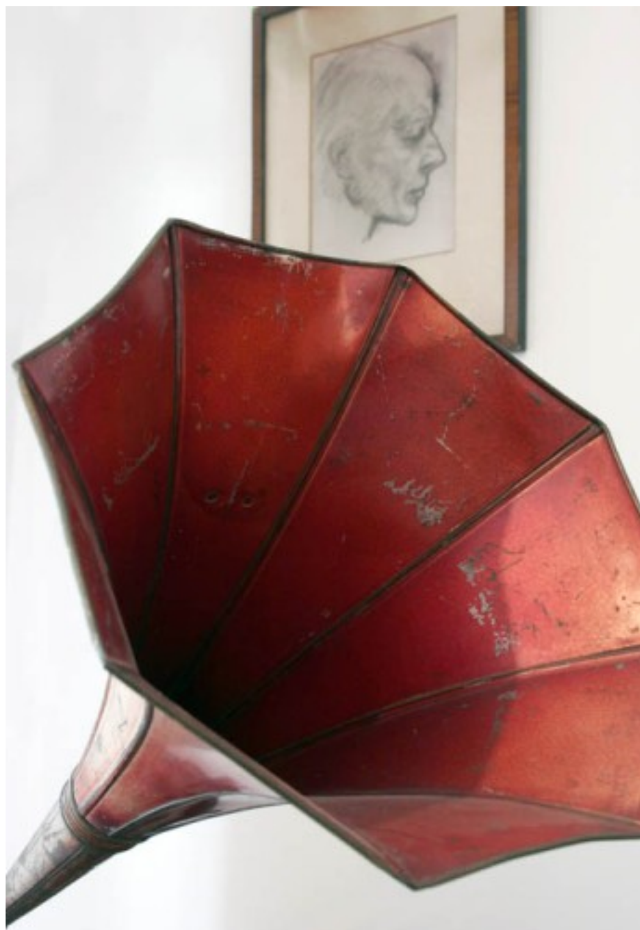
[8]Fotók a Bartók Béla