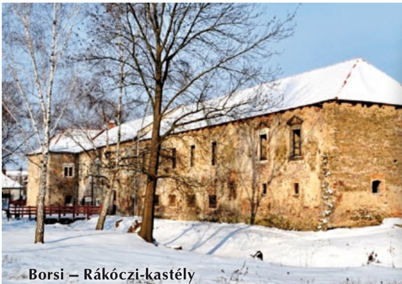
Borsi – Rákóczi-kastély

Április 12. és 13. között a Teleki László Alapítvány könyvtárunkban tartja a Rómer Flóris terv - Megújuló magyar műemlékek a Kárpát-medencében című konferenciáját.