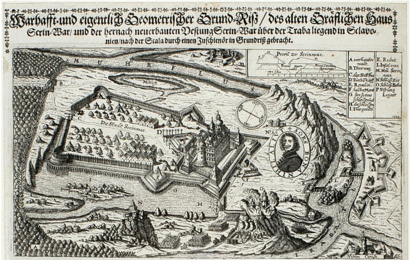
[16] Új-Zrínyivár és Csáktornya madártávlati képe. Nürnberg. 1663 (OSZK RNYT. App. M. 342) [17]