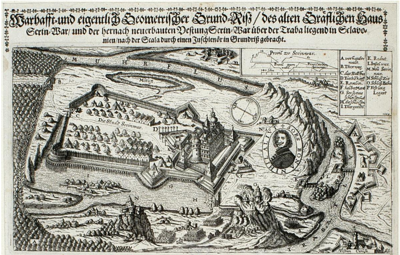
[16] Új-Zrínyivár és Csáktornya madártávlati képe. Nürnberg. 1663 (OSZK RNYT. App. M. 342) [17]