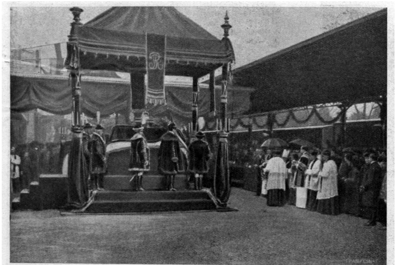
RÁKÓCZI HAMVAINAK BESZENTELÉSE ORSOVÁN.