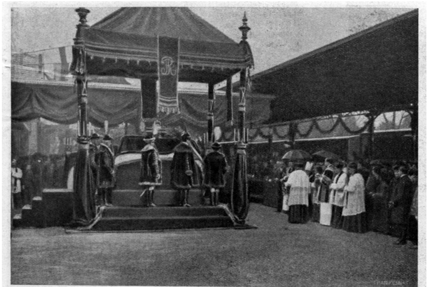
RÁKÓCZI HAMVAINAK BESZENTELÉSE ORSOVÁN.

A magyar országgyűlés október 23-án törölte az 1715. évi 49-ik törvénycikknek a Rákóczit és társait megbélyegző részeit, az uralkodó már másnap szentesítette a határozatot. 1906. október 24-én indult útnak a hajó Konstantinápolyból fedélzetén II. Rákóczi Ferenc, Zrínyi Ilona, Thököly Imre, Rákóczi József, Bercsényi Miklós, Bercsényiné Csáky Krisztina, Eszterházy Antal és Sibrik Miklós hamvaival, és a küldöttség tagjaival. Október 25-én a hajó befutott Konstanca kikötőjébe, a koporsókat és a sírköveket egy feldíszített különvonatra rakták át.