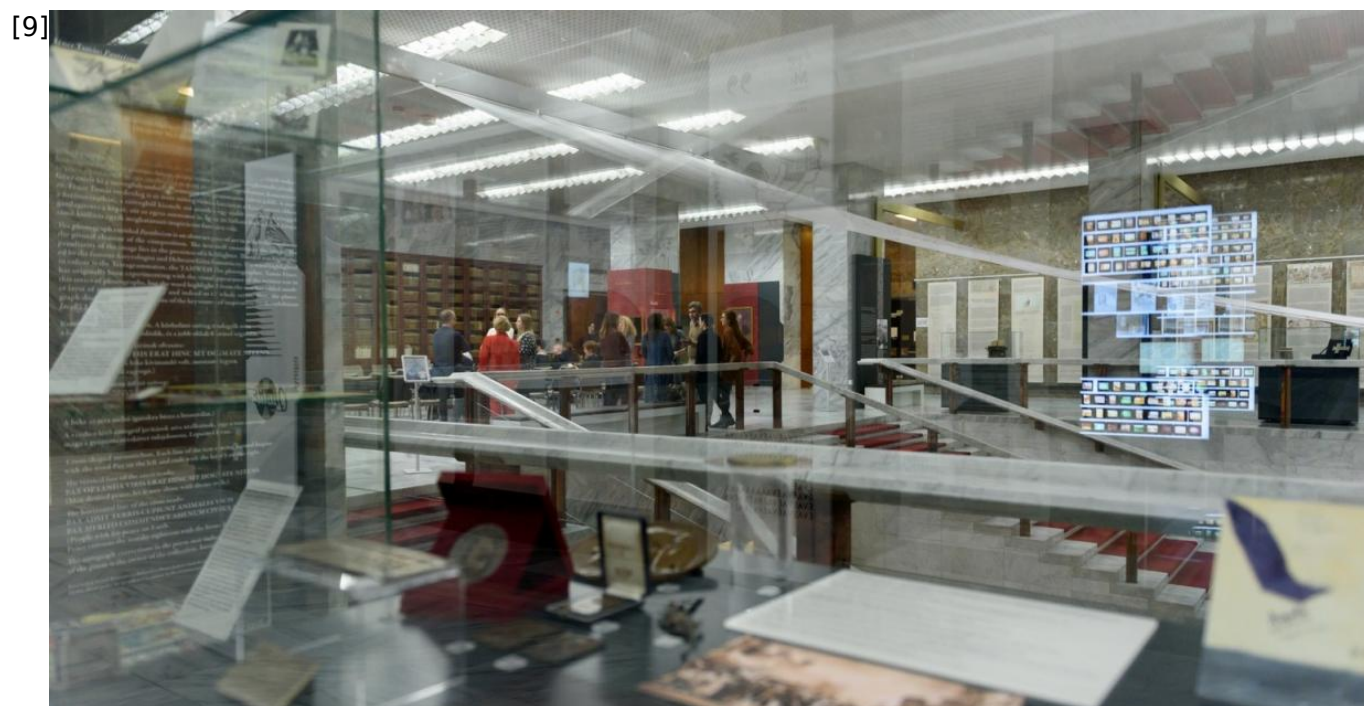
[10] 2023/12/06 - 18:18

Forrás webcím: https://oszk.hu/hirek/versre-magyar-bemutatoest