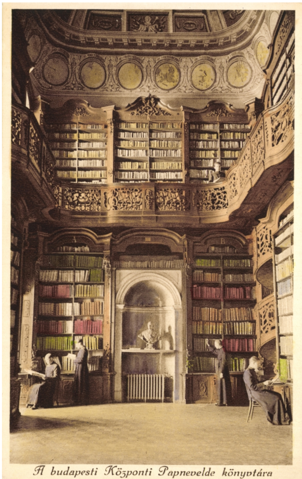
A budapesti Központi Papnevelde könyvtára