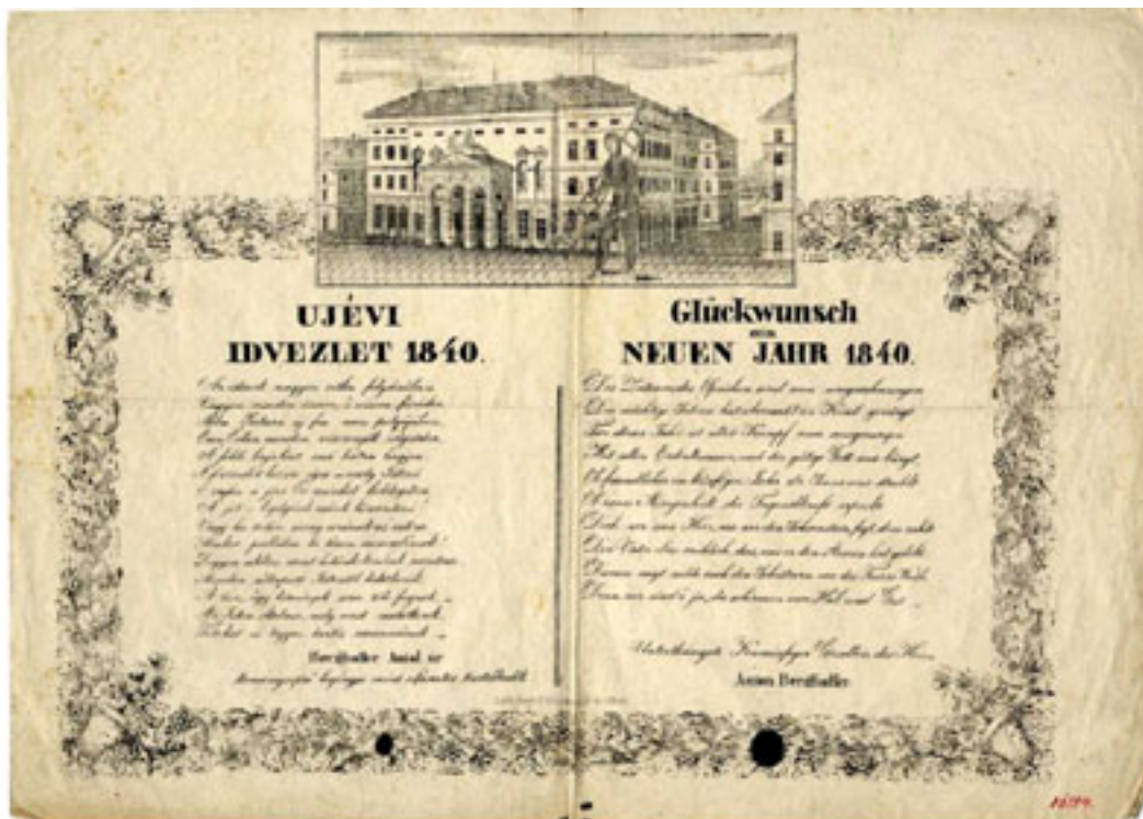
[6]A német nyelvű