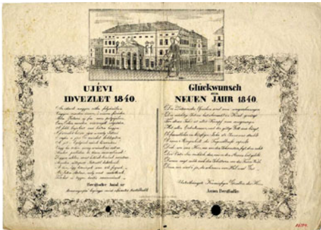
[6]A német nyelvű