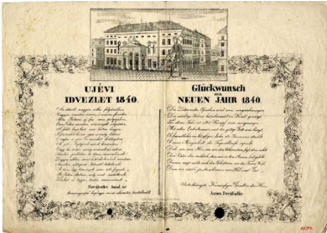
[6]A német nyelvű