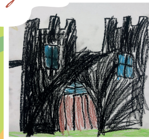
8. Feketeváros kapuja