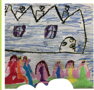
10. Királylány udvara