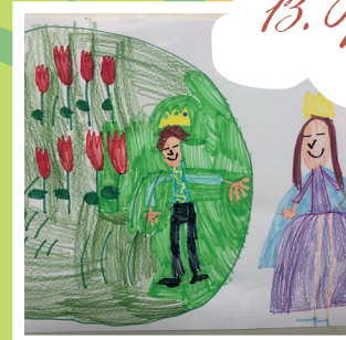
13. Virágos bódé