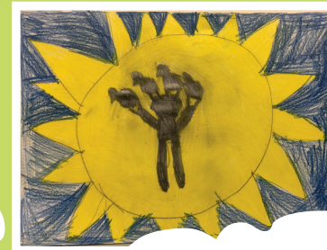
12. A Nap háta mögött