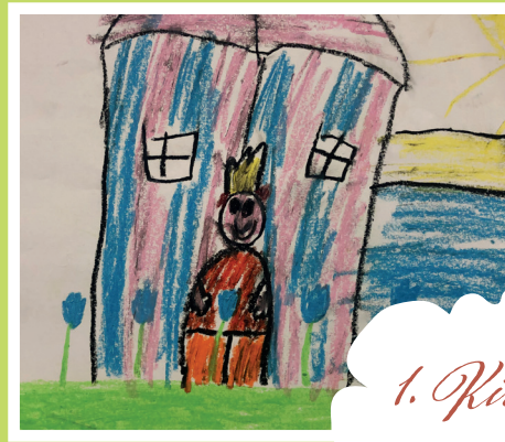
1. Királyi vár