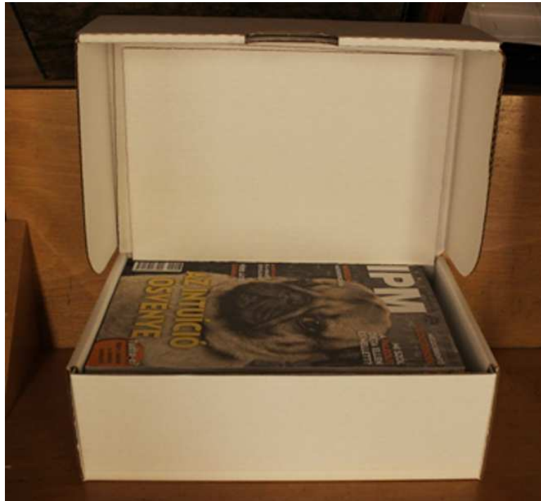
Időszaki kiadványok tárolása savmentes papírral bélelt hullámkarton dobozban